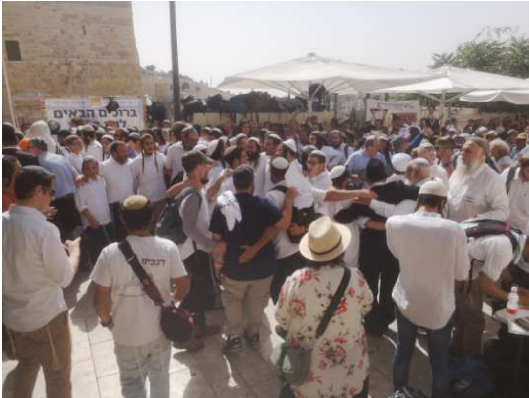
Tanzende Juden auf dem Platz vor der Klagemauer

Erstaunlicherweise entdeckten wir fast keine Touristen auf dem Platz. Auf dem Weg zurück fiel uns auf, dass kaum einer der vielen Läden im Araberviertel geöffnet war und niemand von der dortigen Bevölkerung auf der Straße war.