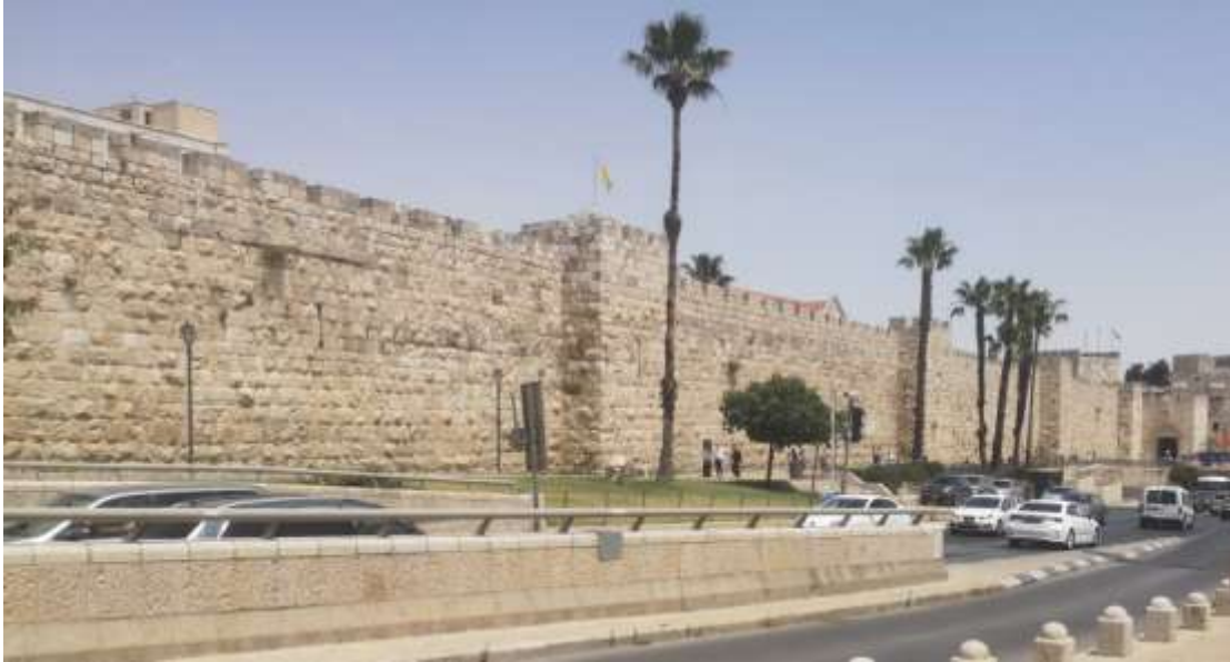
Die Westmauer Jerusalems von außen

Unsere Weiterfahrt nach Jerusalem schien zeitweise gefährdet, weil eben an diesem Freitag der gesamte Zugverkehr in Israel wegen einer Systemumstellung eingestellt war. Bei der Fahrt mit dem Bus konnten wir dafür die Landschaft besser sehen.