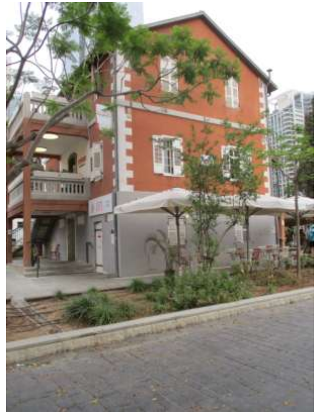
Alte und neue Häuser in Sarona