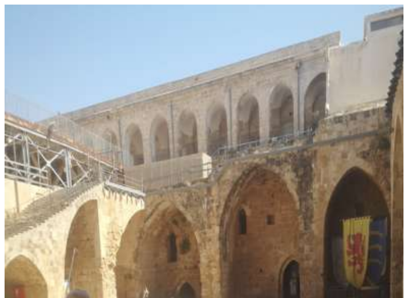
Stadtter und Mauern in Akkon