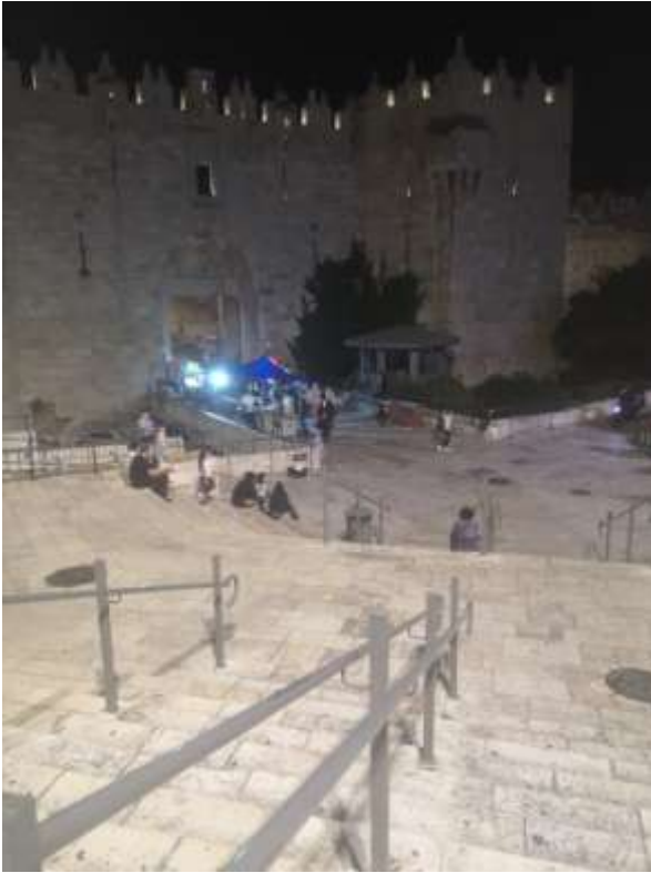
Damaskustor zur Altstadt