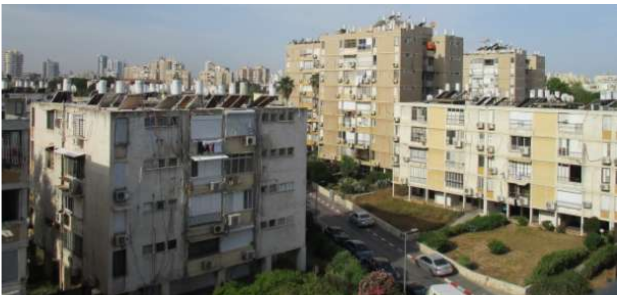
Wohnhäuser im modernen Jaffa