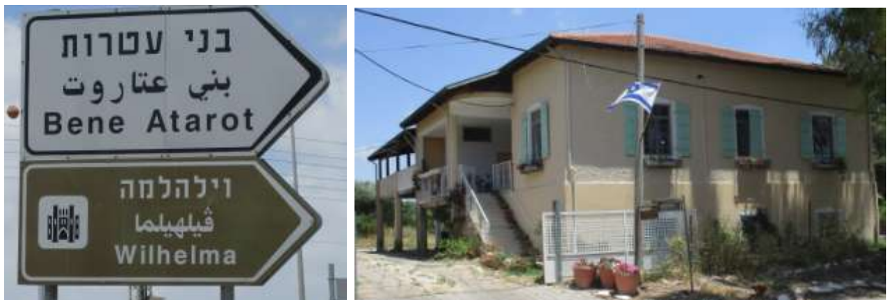
Wilhelma - erhaltenes Wohnhaus