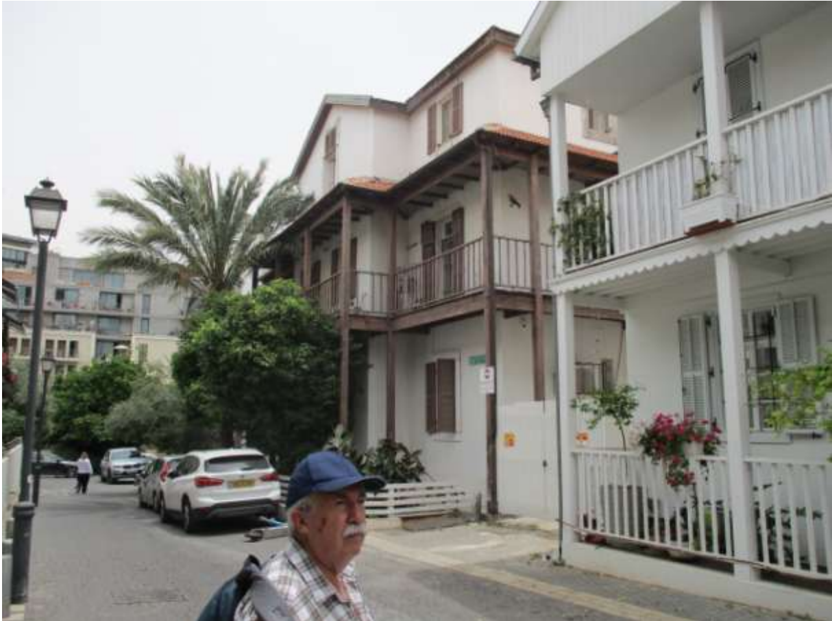
Kolonistenhäuser in der deutschen Kolonie in Jaffa bei der der evangelischen Kirche